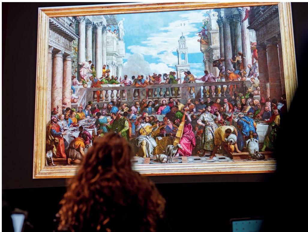
Métamorphosé en centre d'art numérique, le château de Beaugency se pare aujourd'hui de milliers de pixels.

rique agit en réalité comme un pont entre le passé et le présent, offrant de nouvelles façons d'interpréter et d'apprécier les œuvres classiques. Il s'agit d'une forme d'art hybride qui n'est pas une entité isolée, mais qui au contraire s'intègre et coexiste avec le patrimoine culturel existant. Il sert également de catalyseur pour attirer de nouveaux publics vers des formes d'art plus traditionnelles et recréer une forme de flânerie urbaine à travers la redécouverte de l'architecture. Les jeunes générations, en particulier, sont d'abord attirées par l'aspect technologique, mais repartent avec une appréciation renouvelée pour l'histoire et le patrimoine.